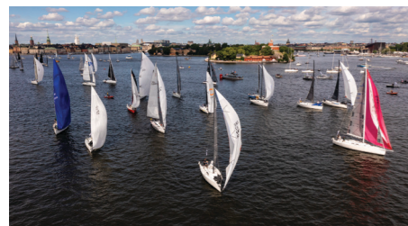
Gotland Runti start Stockholmis

Liinile saime hästi, hea hooga, Pro4U peal, nemad tõmbasid kohe spinni üles ja haihtusid kui tuuleõhk!