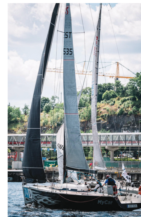
Jaht My Car Gotland Runti startis siirdumas

ega tormifokat ja neid kontrollides avasimegi, et on, mida korrigeerida.