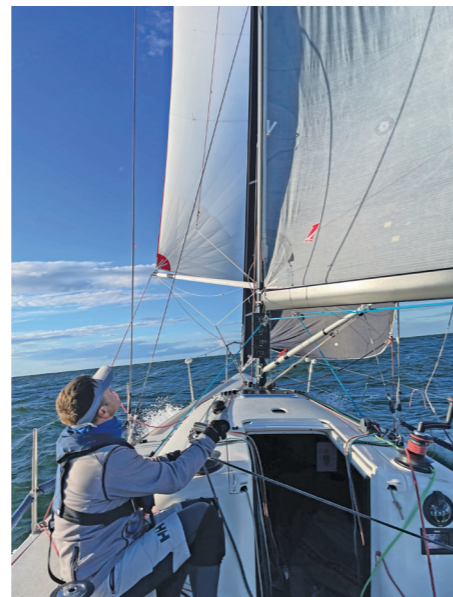
Tuult 10-14 m/s ja sõit spinni kursil

Lained läksid uuesti suureks. Panime spinni valmis, aga üles veel ei tõmmanud. Eespurjega oli kohati kiirus 13,5 sõlme. Väsimus oli veel liiga suur, et finišini kihutada. Käisin magamas ja uuesti välja