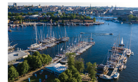
Gotland Runti regati sadam Stockholmi kesklinnas