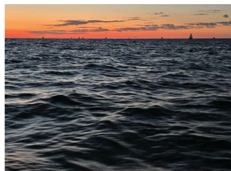
Skäärid läbitud – möödume Alma-grundetist