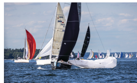
My Car ootamatu pagi meelevaldas

Meil läks natuke aega olukorraga harjumiseks, aga siis läks lahti! Võitlus kohtade pärast, kus jahte kohati ümber 30–60. Ootamatud pagid tulid peale skääride kaljude vahelt, pääsesime kaljust tänu meie ettenägelikkusele. Sellest hetkest on tehtud meist selle kaljunuki pealt ka äge pilt.