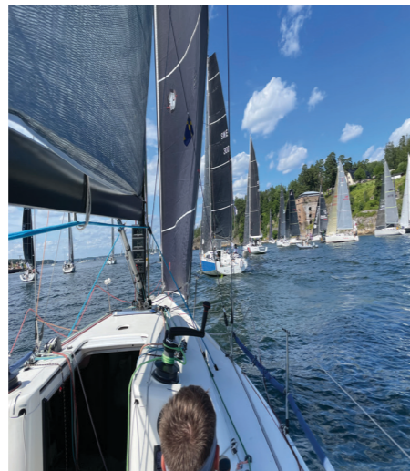
Skääride üht kitsaimat kohta läbimas

Umbes kuue tunni järel, kui olime skäärid läbinud, tundsin kergendust ja olime uhked, et saime sellise asja läbi laadida jne.