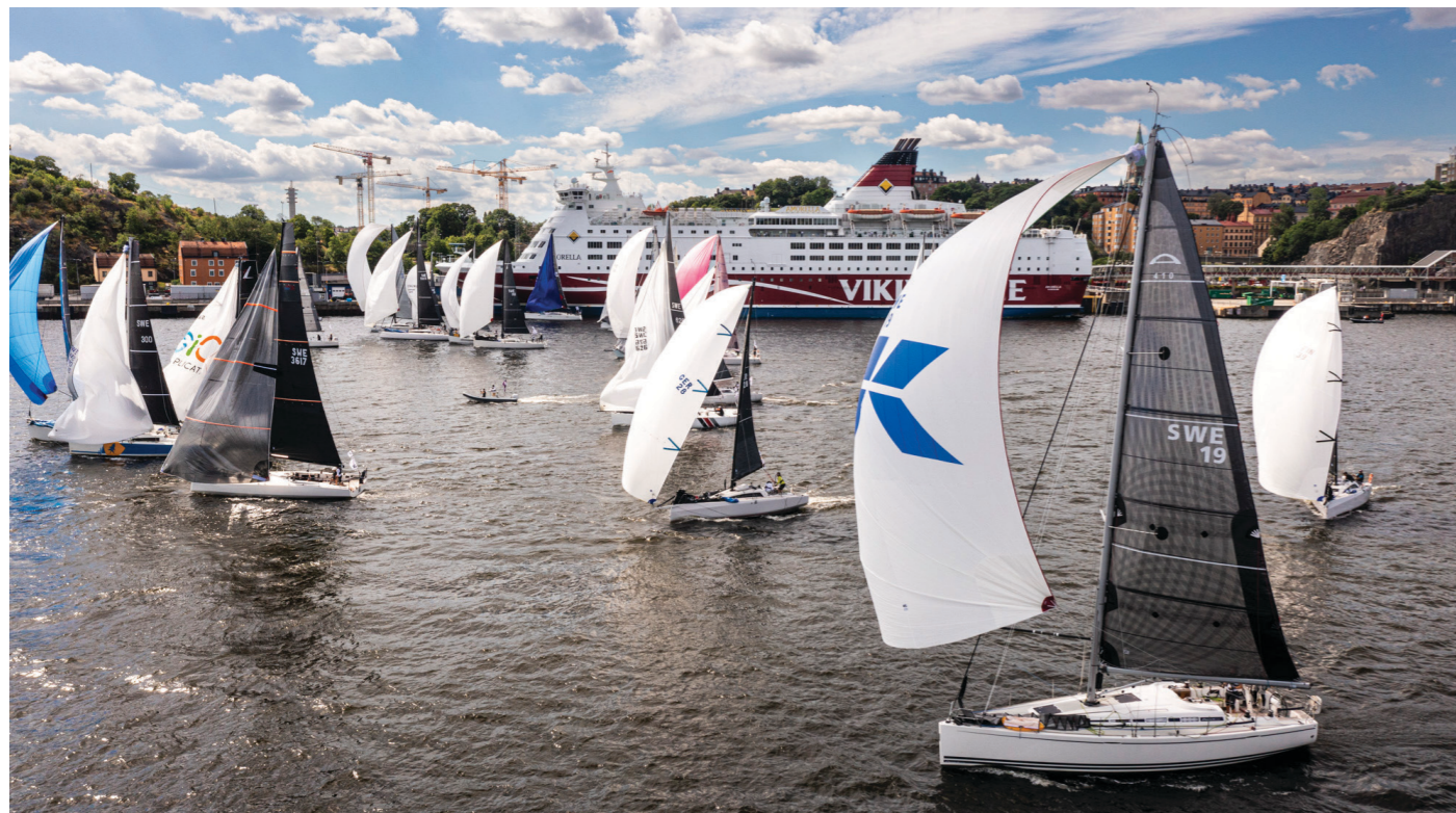
Gotland Runti 2022 start Stockholmis