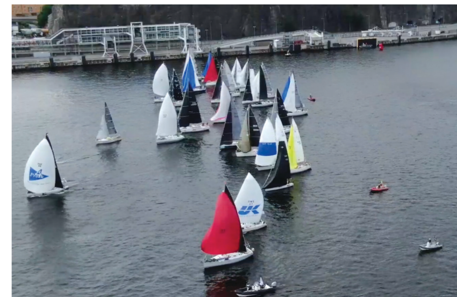
Kaader stardivideost – Pro4U hoogne algus ja My Car ilma spinnakerita startimas nende taga